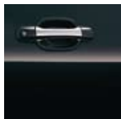
BLACK SAPPHIRE MICA