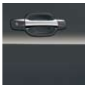
ROYAL GRAY METALLIC