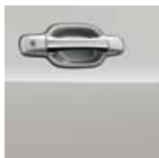
STERLING SILVER METALLIC