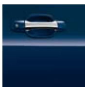
ZENITH BLUE MICA